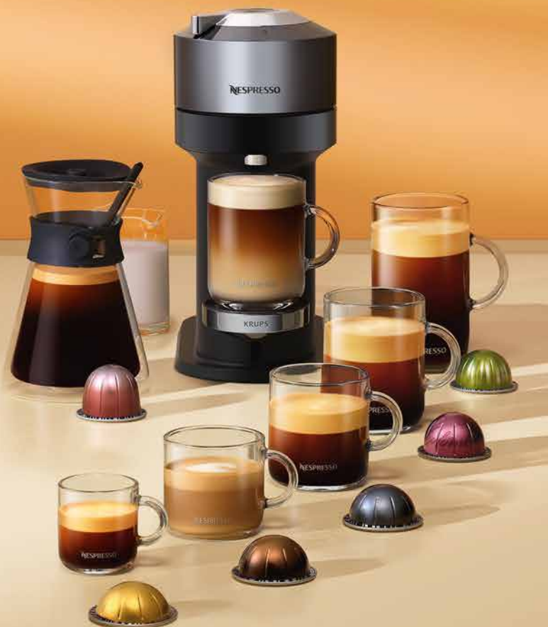
Suggestion de présentation